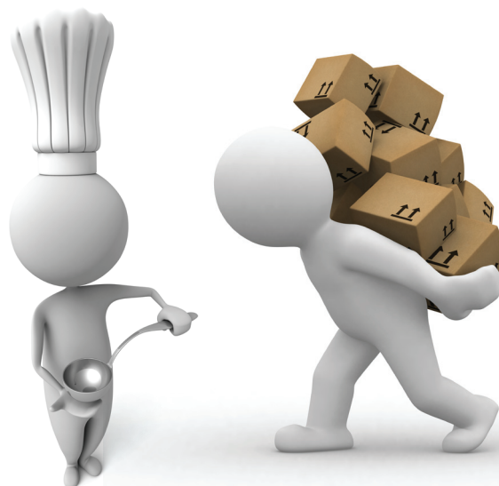
Najčešći sezonski poslovi: ugostiteljstvo i rad na građevini

Najčešći sezonski poslovi su radovi na građevini, utovar/istovar, pomoćni poslovi, berači voća na plantažama, zatim promoterke, anketari, prodavci sladoleda, konobari, kuvari, poslastičari, recepcionari, sobarice i drugi ugostiteljski poslovi.